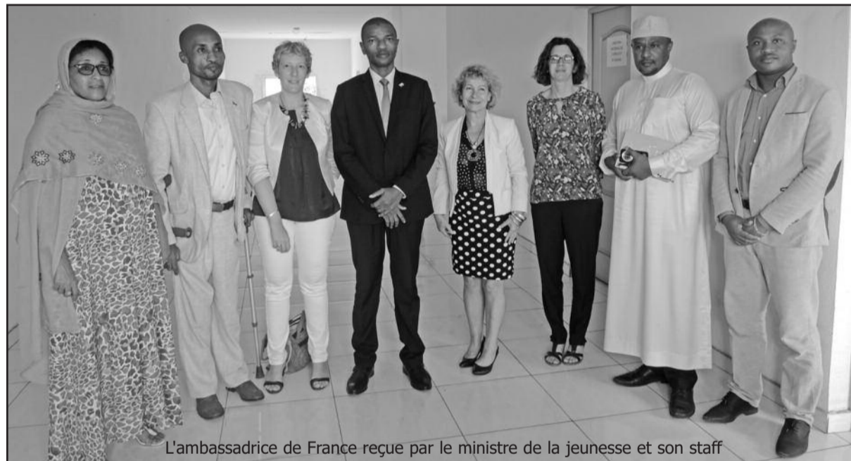
L'ambassadrice de France reçue par le ministre de la jeunesse et son staff

La nouvelle ambassadrice de France aux Comores a rencontré jeudi dernier le ministre de la jeunesse et des sports. Il était question au menu des échanges d'une prise de contact entre les deux personnalités et surtout les priorités du ministère.