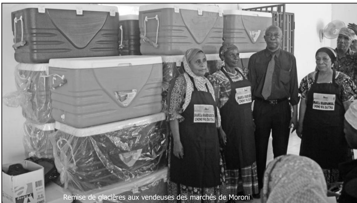
Remise de glacières aux vendeuses des marchés de Moroni

La vice-présidence en charge de la pêche a remis jeudi dernier, des glacières et des tabliers aux vendeurs et vendeuses des trois marchés de la capitale. Une opération qui devrait se poursuivre dans les trois îles.