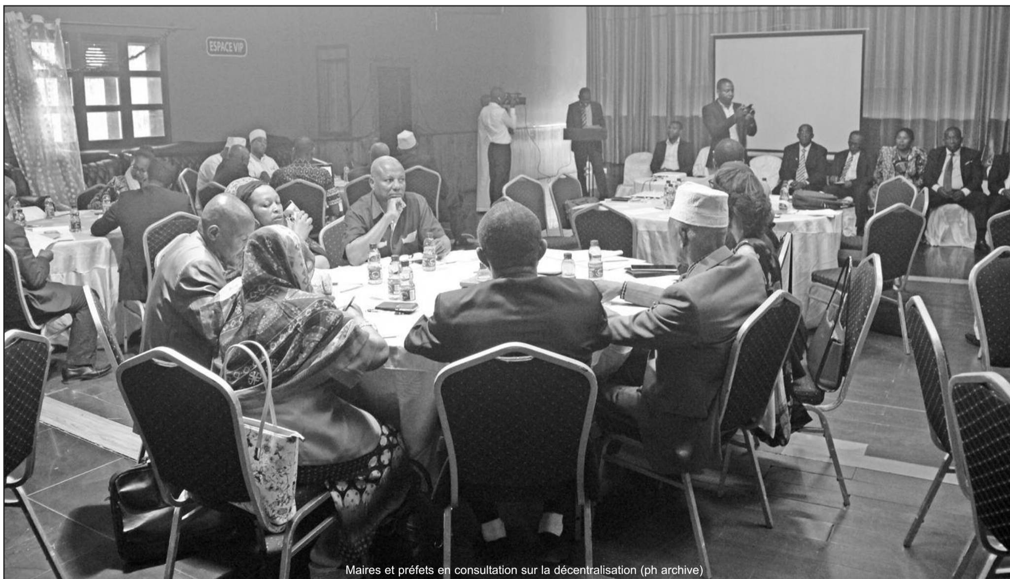
Maires et préfets en consultation sur la décentralisation (ph archive)